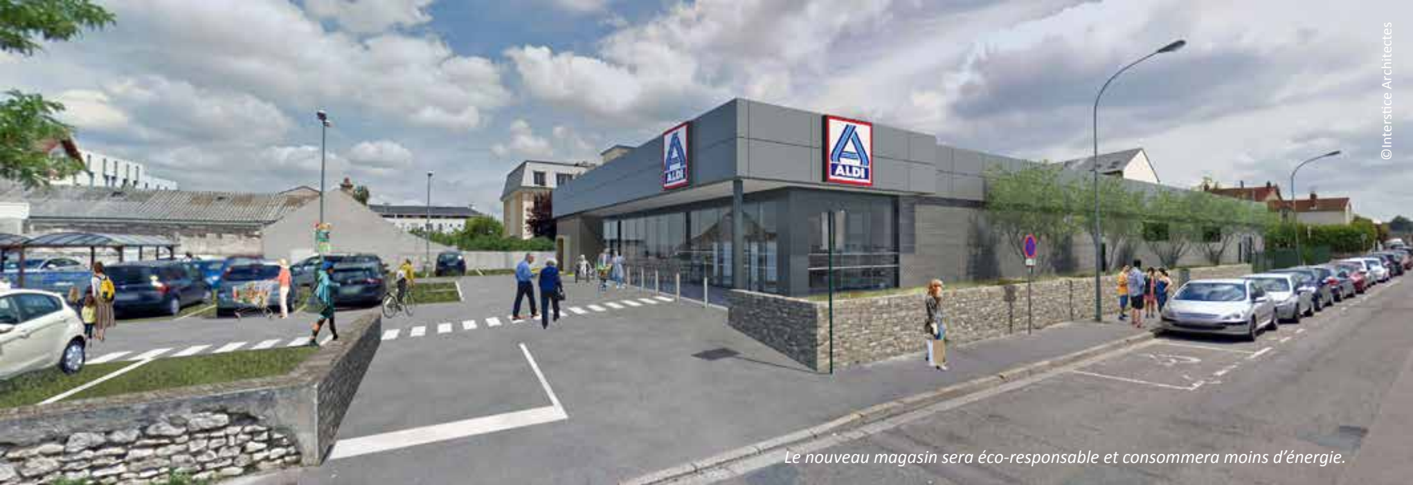
Le nouveau magasin sera éco-responsable et consommera moins d'énergie.