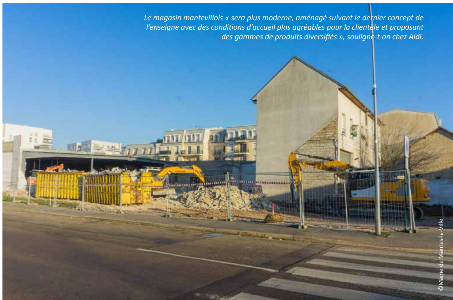
Le magasin mantevillois « sera plus moderne, aménagé suivant le dernier concept de l'enseigne avec des conditions d'accueil plus agréables pour la clientèle et proposant des gammes de produits diversifiés », souligne-t-on chez Aldi.

« Le magasin sera mieux adapté pour le personnel avec des conditions de travail et de manutention optimales », poursuit l'enseigne. Le pavillon à l'angle des rues René Valognes et Dreux a été démoli, afin de repenser entièrement l'aire de livraison. Une entrée et une sortie distinctes et sécurisées par des portails coulissants seront aménagées afin d'éviter aux camions des manœuvres pouvant engendrer des désagréments.